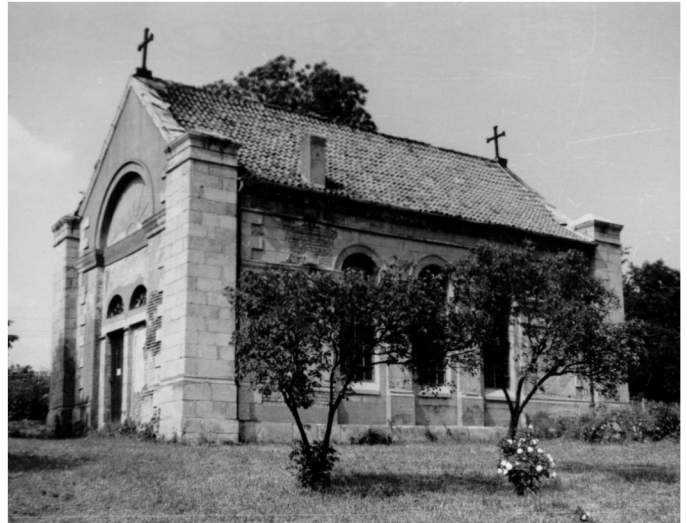
Historische Ansicht der Vorgängerkirche gebaut 1831, in den 60er Jahren abgebrochen