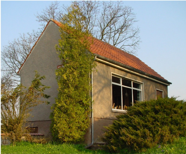
Heutige Kapelle, Kapellenansicht von Südosten