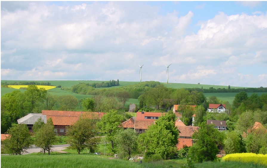
Ortsansicht von Süden