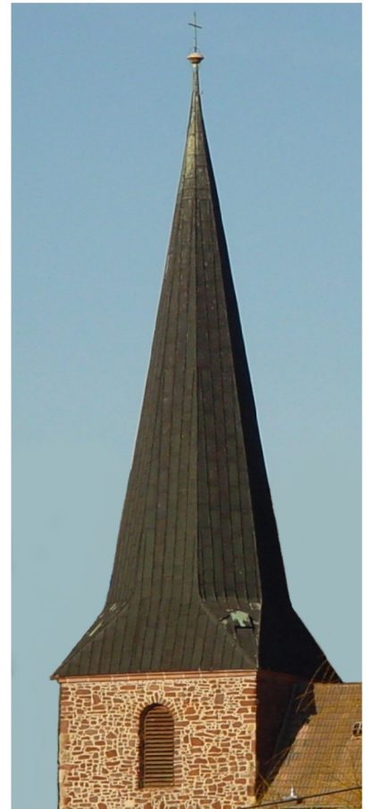
Westturm 40 m hoch mit oktagon. Turmdach