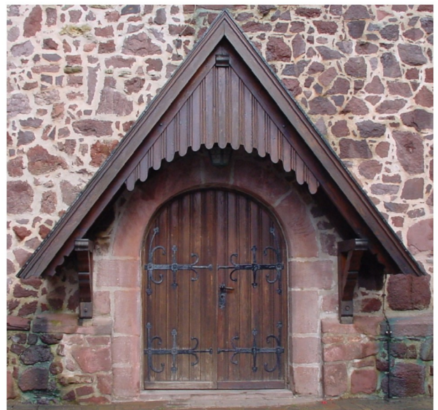
Kircheneingang im Westturm