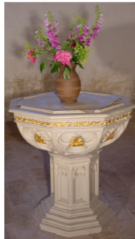
Taufpult von 1732