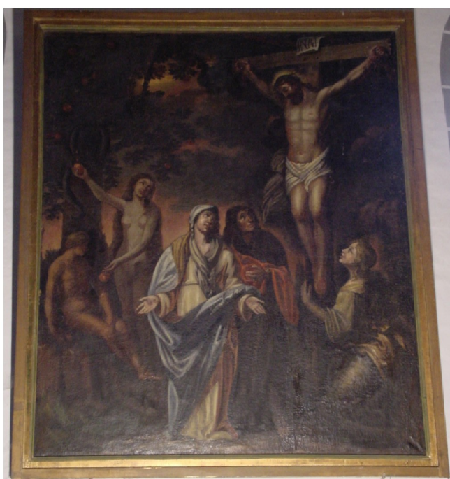
Bild im Kirchenraum