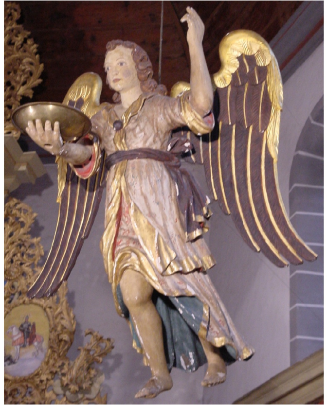
Taufengel, um 1700 geschaffen