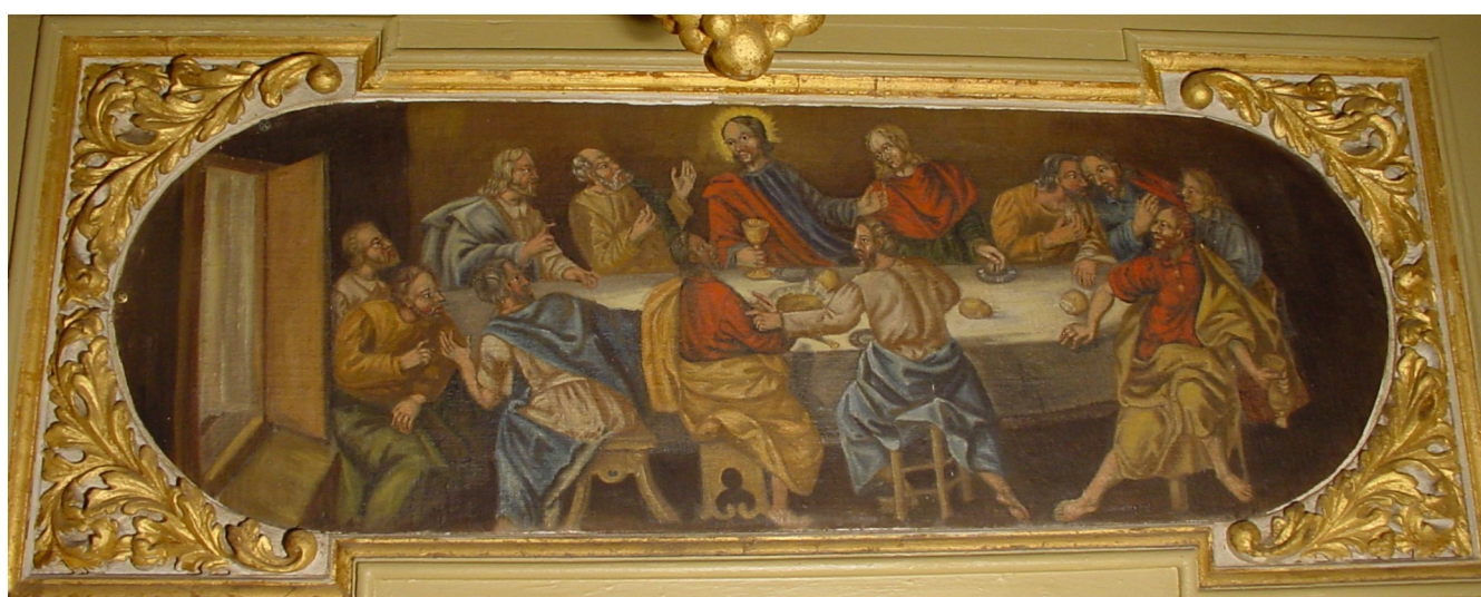
Unteres Altarbild, letztes Abendmahl, vermutlich von 1707