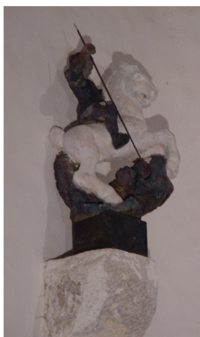
Statue St. Georg im Chor