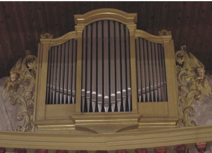
Barocke Orgel von Ladegast 1710