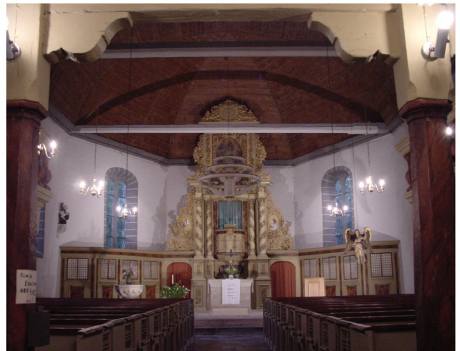
Innenansicht in Richtung Chor

Kirchenachse: O - W Kirche: Länge 34 m, Breite 15 m, Höhe 15 m Grundfläche 487 m 2 , Turm: Länge 8,1 m, Breite 8,5 m, Höhe 40 m Turmhöhe / Kirchenlänge = 1,19