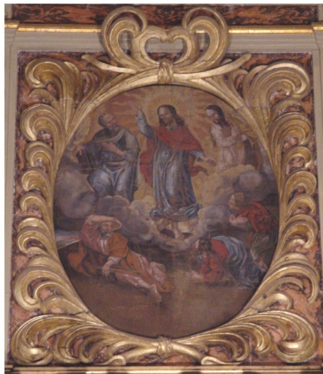
Oberes Altarbild, schwebender Christus v. 1681