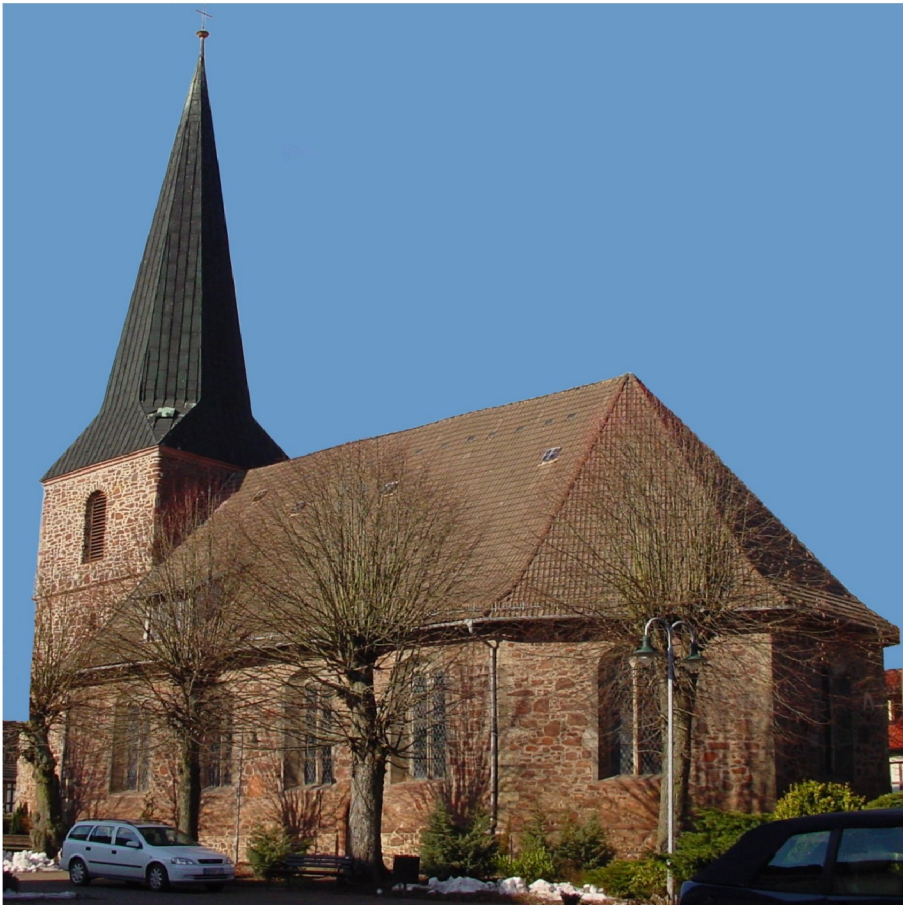
Kirchenansicht von Südosten