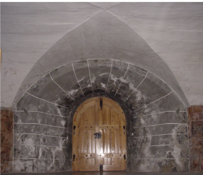
Turmerdgeschoß mit Kreuzradgewölbe