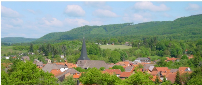
Ortsansicht von Südosten