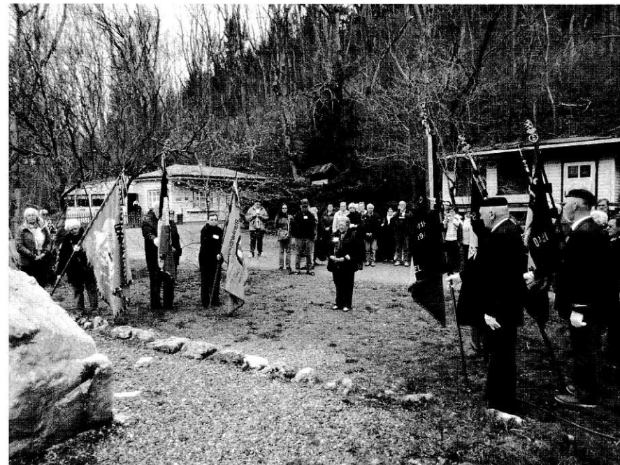
,Vriendenkring van DORA' Pelgrimage 14-04-2015 Pèlerinage ,Amicale de DORA' Rottleberode , 'Heimkehle'