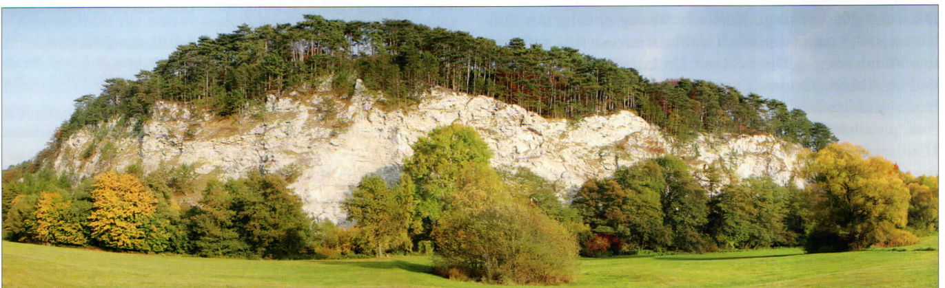
Abb. 4: Die durch die vorbeifließende Uffe geprägte Gips-Steilwand des Sachsensteins bei Bad Sachsa-Neuhof.