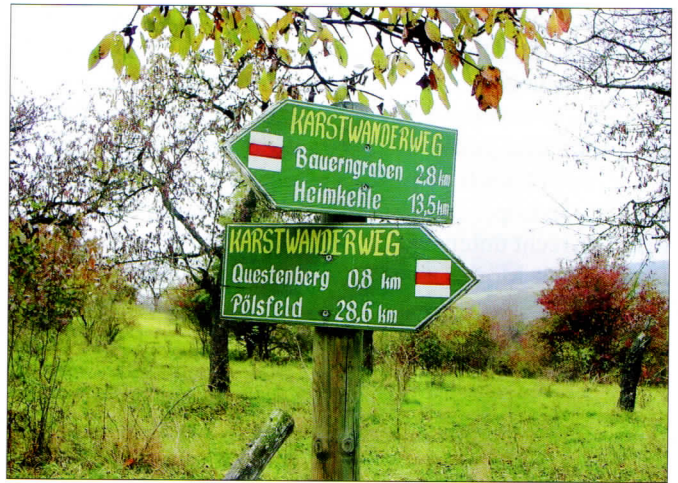
Abb. 6: Von Pölsfeld im Osten bis Förste im Westen – der Karstwanderweg bietet mit ca. 200 Erläuterungstafeln Informationen über Geologie und Landschaft, Umwelt- und Naturschutz, Grundwasser sowie Siedlungs- und Industriegeschichte.

Der rund 265 km lange Karstwanderweg entlang des Südharzes ist der multithematisch wohl am intensivsten aufbereitete Wanderweg in Deutschland. Im Landkreis Nordhausen und im Altkreis Osterode am Harz bestehen wegen der größeren geologischen Flächenausdehnung der Karstlandschaft zwei parallele, aber verbundene thematische Wanderwege. Hier lassen sich Abschnitte beider Wege sinnvoll zu Tagestouren verbinden. Die Lage der Karsterscheinungen bedingt den Routenverlauf. An wichtigen Standorten geben ca. 200 Erläuterungstafeln Informationen über Geologie und Landschaft, Umwelt- und Naturschutz, Grundwasser sowie Siedlungs- und Industriegeschichte. Der Karstwanderweg berührt geschützte Natur- und Kulturdenkmale und quert Naturschutzgebiete. Er soll über die ökologischen Zusammenhänge in der Natur