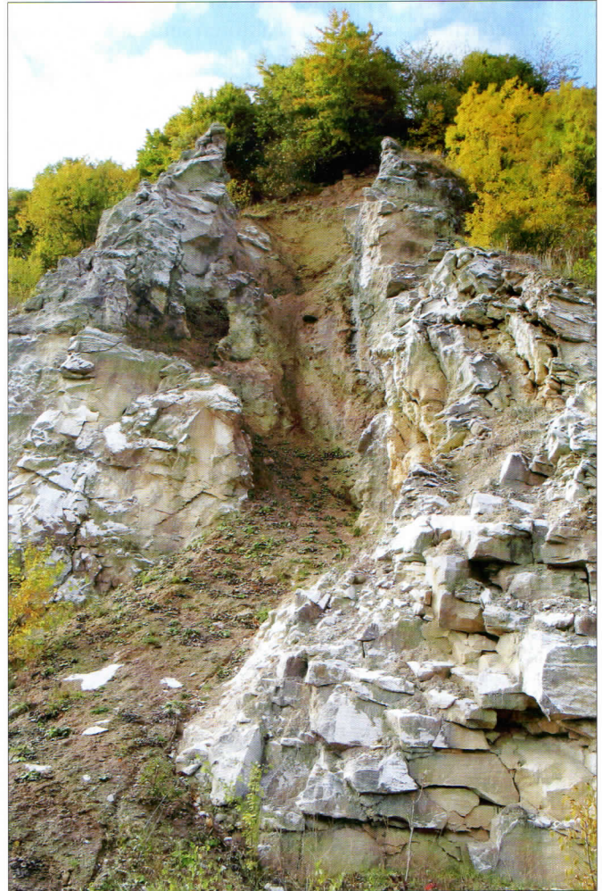
Abb. 1: Von Wasser aufgelöst und wieder zusedimentiert – gefüllte Karstschlotte im Gips bei Osterode.

Gips und Anhydrit bilden meist feinkörnige, massige Gesteine. Gips tritt zudem als Fasergips auf Schicht- und Klufflächen, als spätiges, blättriges, durchsichtiges Marienglas oder in kompakter Form als durchscheinender Alabaster auf. Durch sekundäres Wachstum von Gipskristallen weist der Gipsstein mitunter sogar ein porphyrisches Gefüge auf. Anhydritstein kann ebenso mit einem dichten, stängeligen, körnigen oder spätigen Gefüge auftreten. Während Gipsstein eine eher weiße bis braun-graue Farbe hat, tendiert der Anhydritstein zu einer weiß-grauen, auch bläulichen oder rötlichen Färbung. Beim Anschlag riecht letzterer meist schwach bituminös. Durch