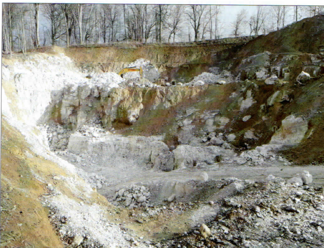
Abb. 5: Landschaftsverlust wertvollster Gipskarstgebiete im Südharz durch Steinbruchbetrieb, hier am Pfaffenholz bei Tettenborn-Kolonie (Foto Friedhart Knolle).

Die in Deutschland wirtschaftlich nutzbaren Sulfatgesteine wurden und werden auch heute noch im Geoparkgebiet vielerorts genutzt. Der Abbau von Gips hatte im Braunschweiger Land – im Gegensatz zum südlichen Harzvorland – keine große Bedeutung. Dennoch standen auch hier früher einmal lokale Gipsvorkommen in Abbau (KNOLLE et al. 2011). Ganz anders im Südharz – hier wurde bereits in historischer Zeit Bodenabbau und Bergbau betrieben. Es befinden sich zahlreiche Gipssteinbrüche im Gebiet. Der Gips bildet nicht nur die Voraussetzung für die Südharter Karstlandschaft, sondern besitzt auch als Baustoff große Bedeutung. Der abgebaute Gips wurde früher zur Mörtelbereitung und für die Herstellung von Estrichböden genutzt, wozu er gebrochen, gebrannt und gemahlen wurde. Anhydrit wurde als Baustoff für Häuser verwendet. Von besonderem Wert war das Marienglas, das als Schmuck Interesse fand. Heute werden die Gips- und Anhydritsteine überwiegend zu Baugips, Spezialgips, Gipsmischungen, Gipskartonplatten sowie in Zementen verarbeitet. Die Gipsindustrie ist somit in besonderem Maße von der Bauindustrie abhängig. Aktive Steinbrüche finden sich im Geopark-Gebiet schwerpunktmäßig im Raum Osterode am Harz, Bad Sachsa-Walkenried, Ellrich und Nordhausen. Zwischen den gesellschaftlichen Interessen des Natur- und Landschaftsschutzes und dem Rohstoffabbau besteht ein dauerhafter Nutzungskonflikt, der bisher ungelöst ist.