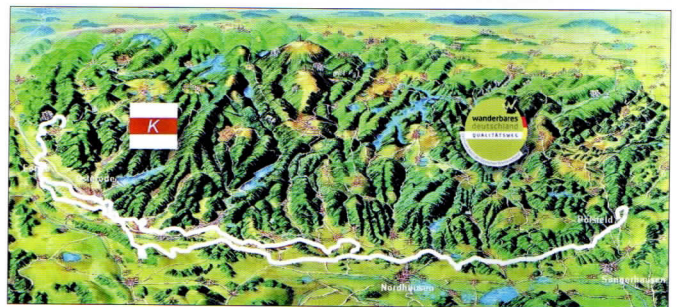
Abb. 7: Der Karstwanderweg erschließt mit 265 km Wegstrecke die Gipskarstlandschaft in den Landkreisen Mansfeld-Südharz (Sachsen-Anhalt), Nordhausen (Thüringen) und im Altkreis Osterode am Harz (Niedersachsen, jetzt Landkreis Göttingen) (Grafik Förderverein Deutsches Gipsmuseum und Karstwanderweg e.V.).

und die Geschichte des Südharzes aufklären ( www.karstwanderweg.de ).