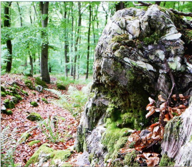
Abb. 3: Grüner Gipskarst im Alten Stolberg, Südharz (Foto BUND Nordhausen).