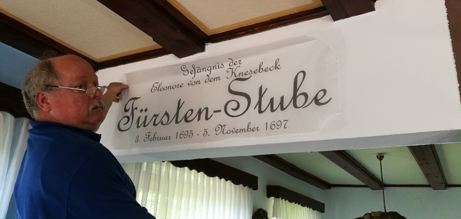
Fotos aufgenommen in der Ausflugs-gaststätte „Burguine Scharzfels“