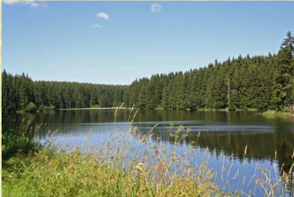
Nr. 137: Bärenbrucher Teich