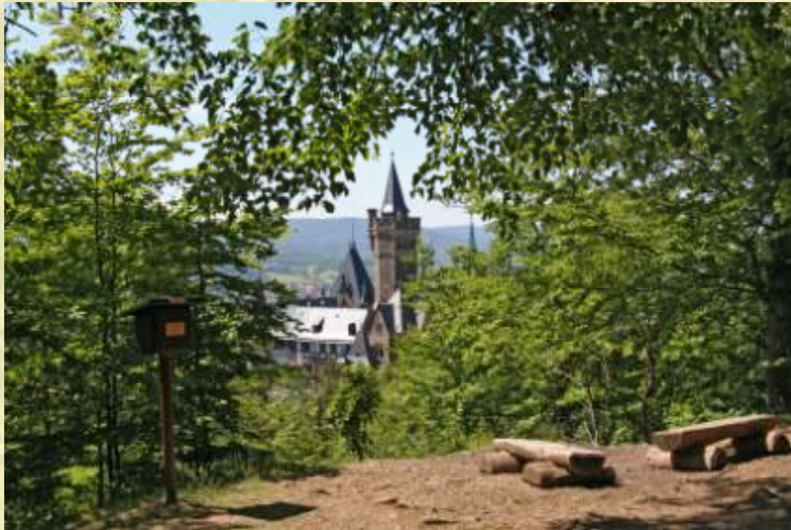
Nr. 31: Agnesberg