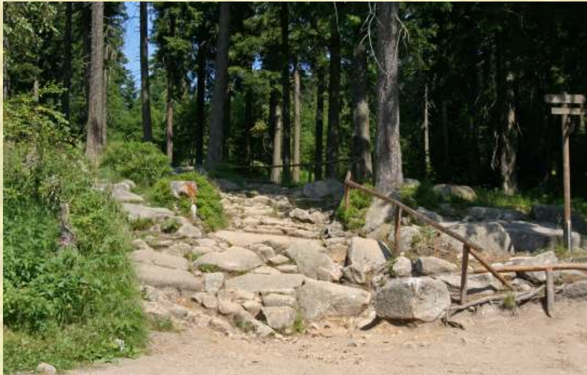
Nr. 11: Eckerloch