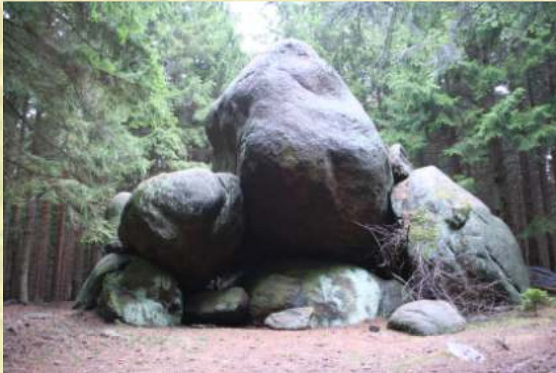
Nr. 5: Froschfelsen