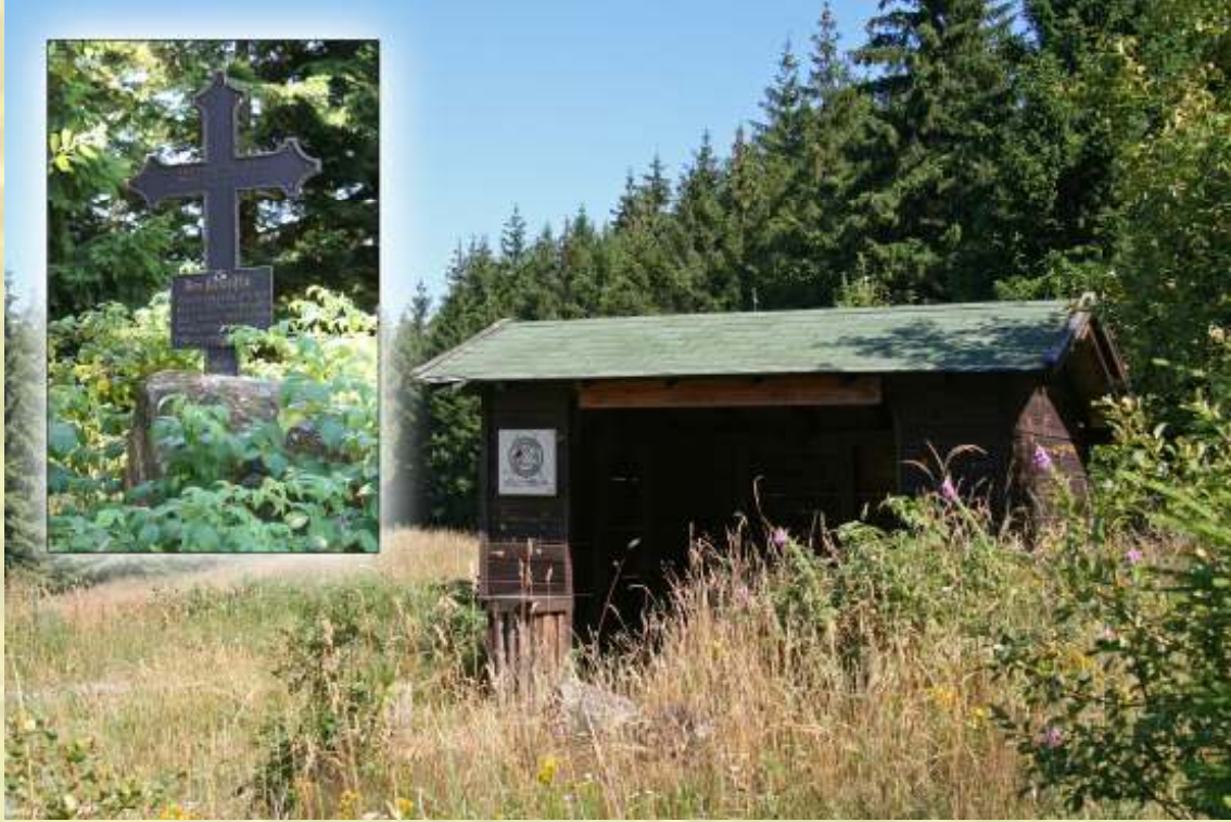
Nr. 3: Kruzifix