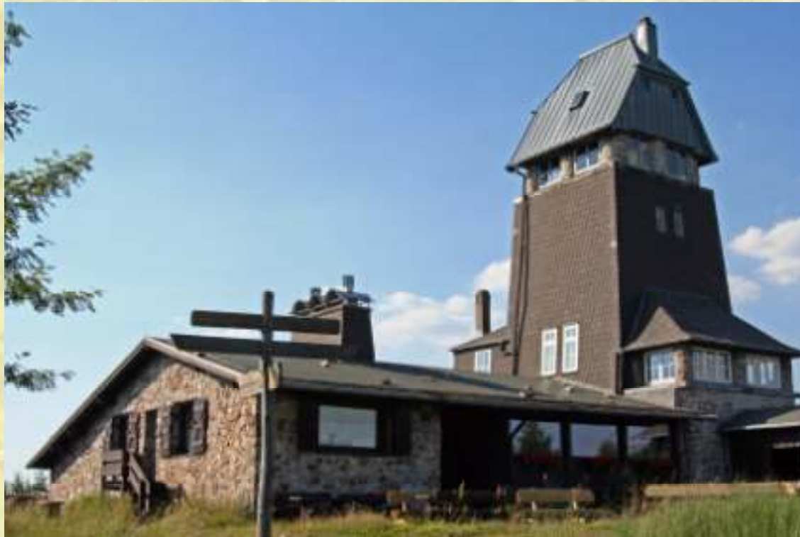
Nr. 144: Hanskühnenburg