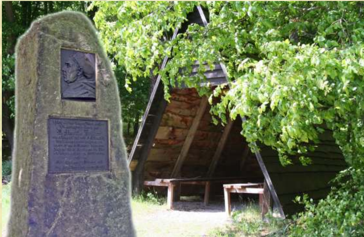
Nr. 29: Schutzhütte am „Lutherstein“