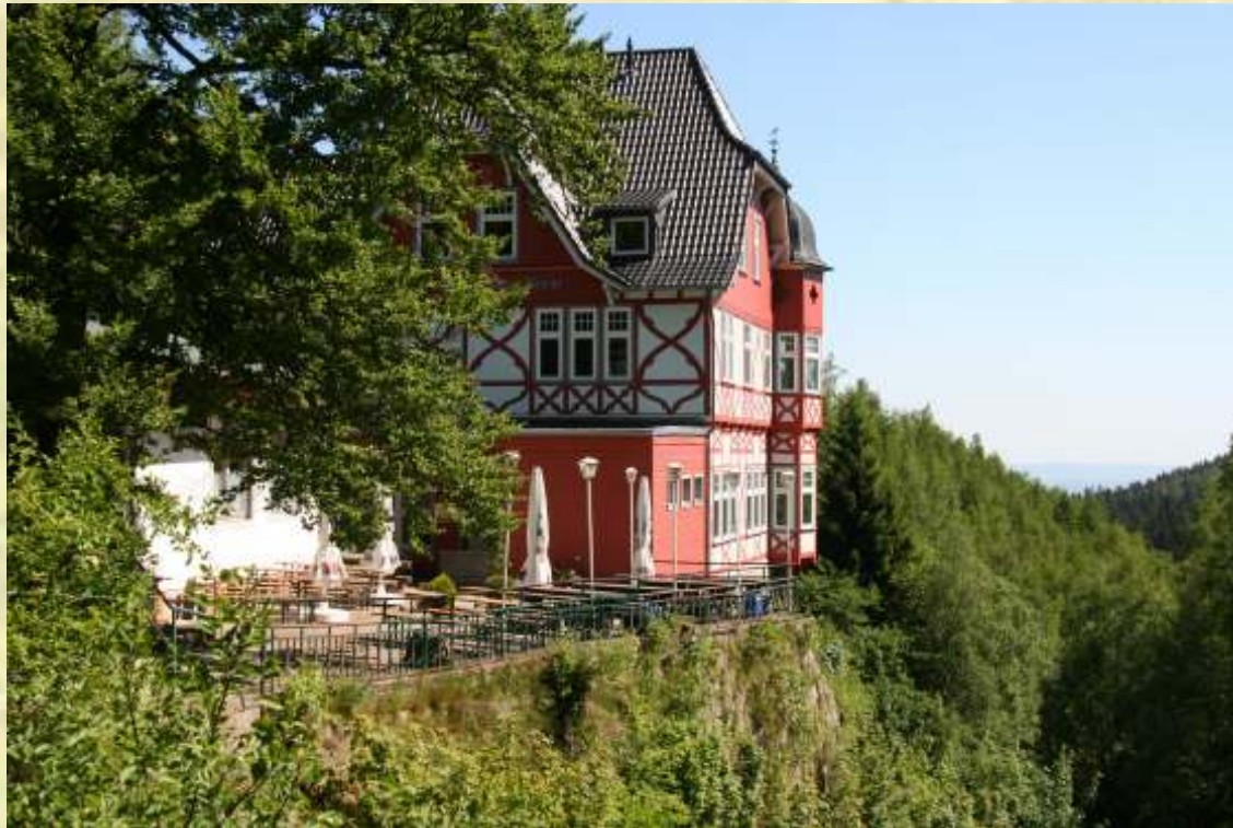
Nr. 28: Gasthaus Steinerne Renne