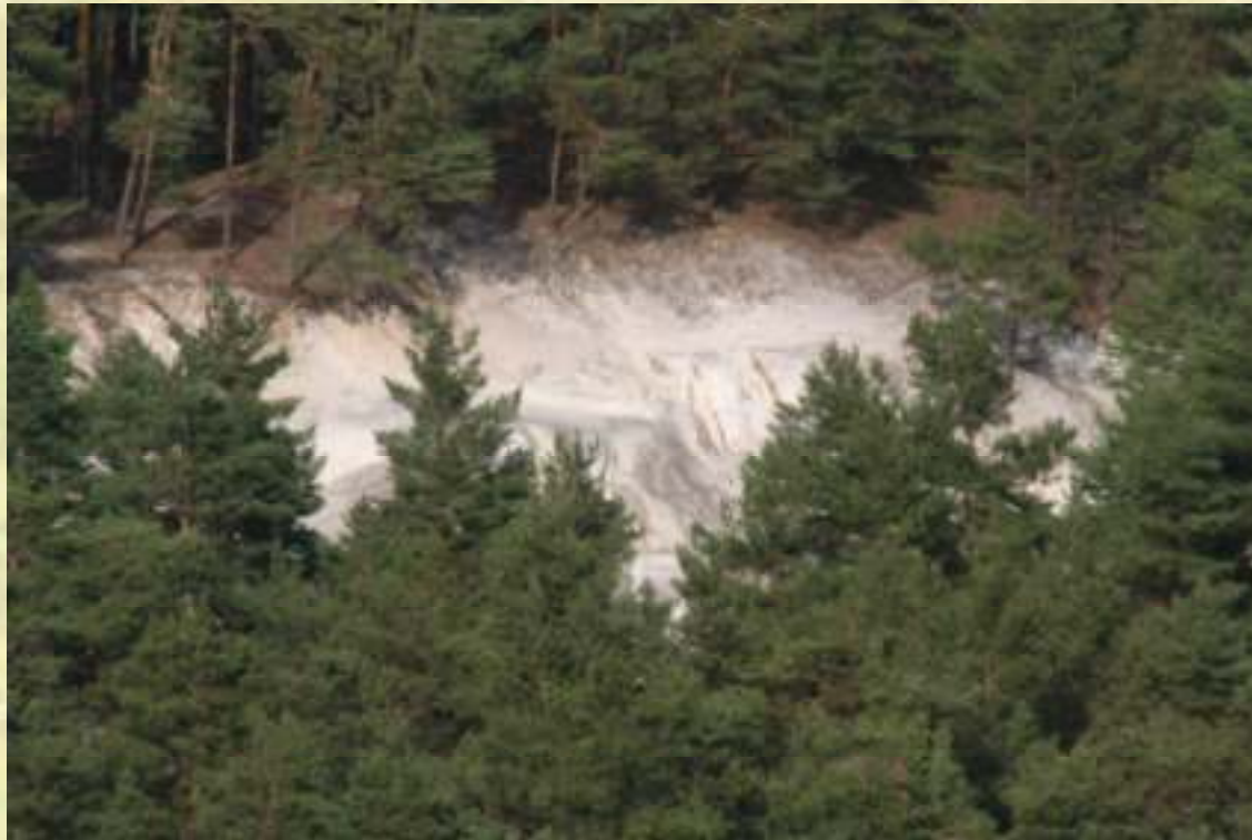
Nr. 81: Sandhöhlen im Heers