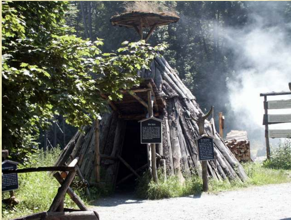
Nr. 60: Köhlerei Stemberghaus