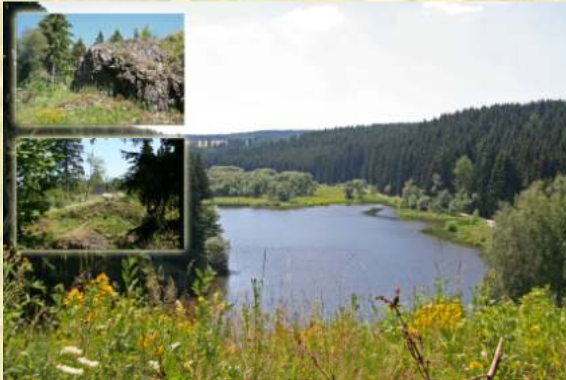
Nr. 52: Trageburg am Hexenstieg