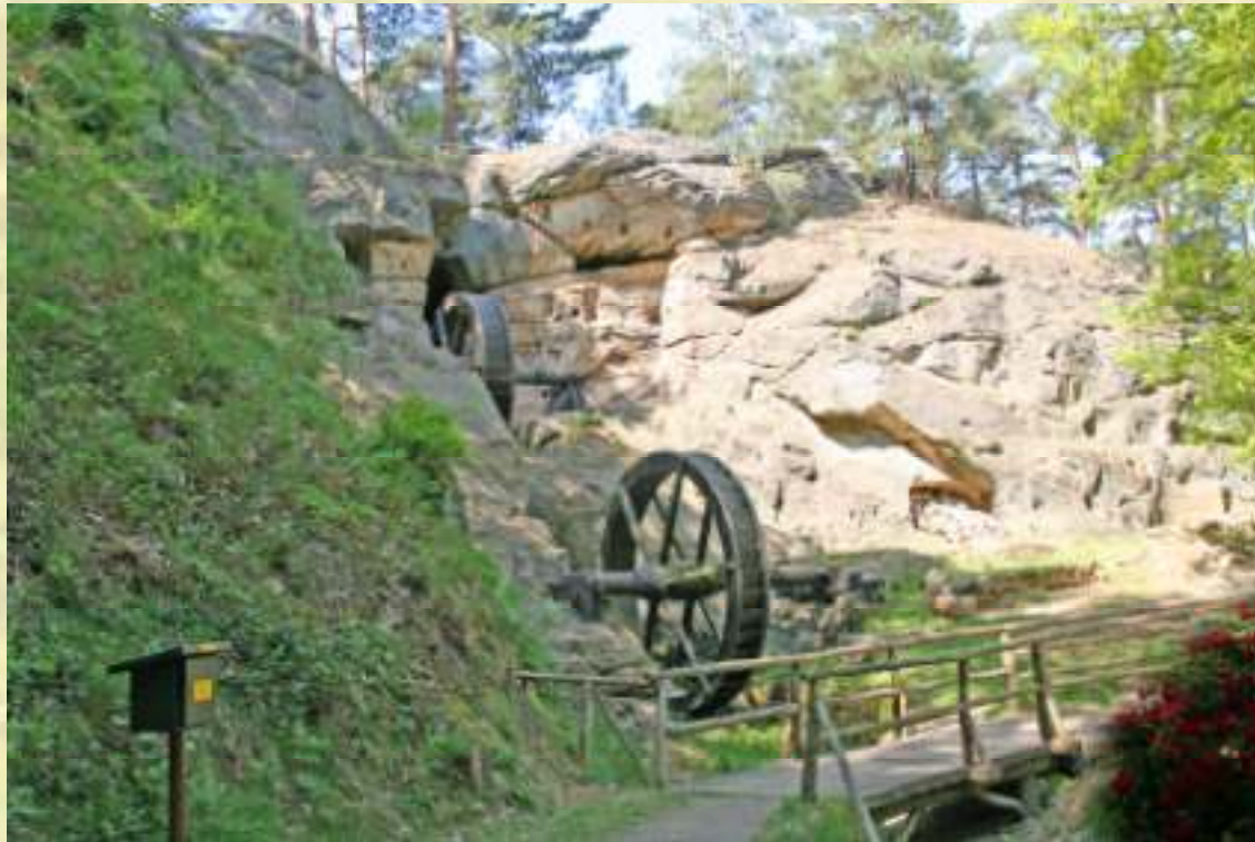
Nr. 82: Regenstein-Mühle