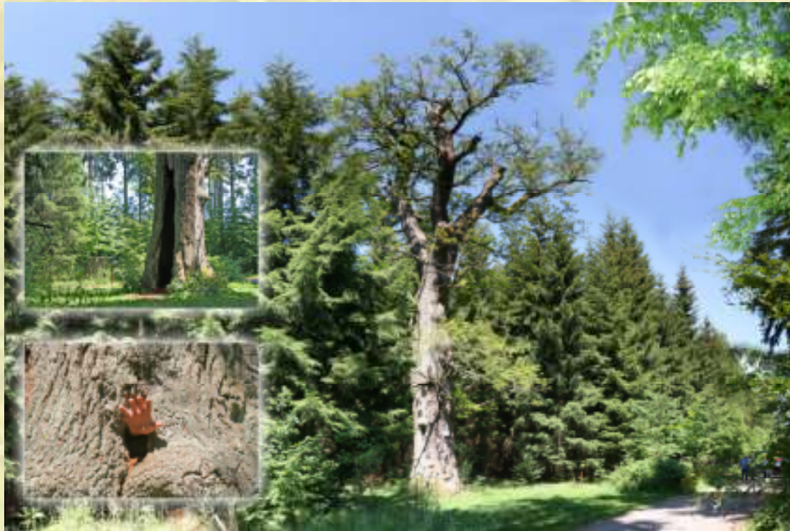
Nr. 57: Hohle Eiche