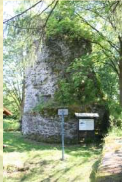
Nr. 41: Ruine Königsburg