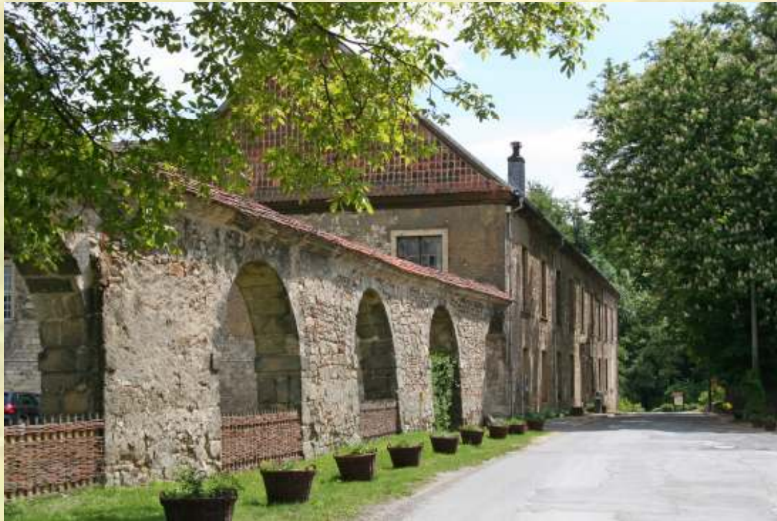
Nr. 86: Kloster Michaelstein