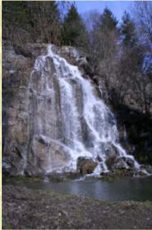
Nr. 40: Königshütter Wasserfall