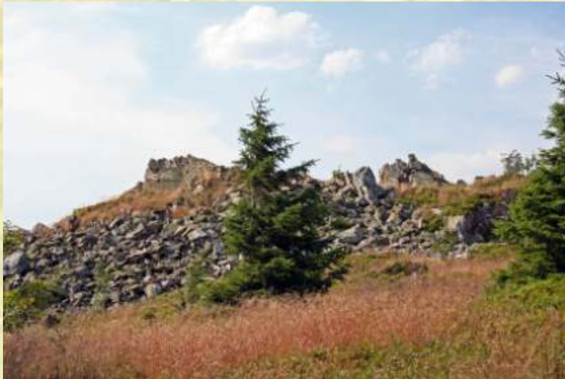
Nr. 135: Wolfswarte