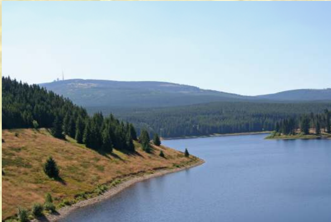
Nr. 1: Eckertalsperre (schönste Stempelstelle 2007)