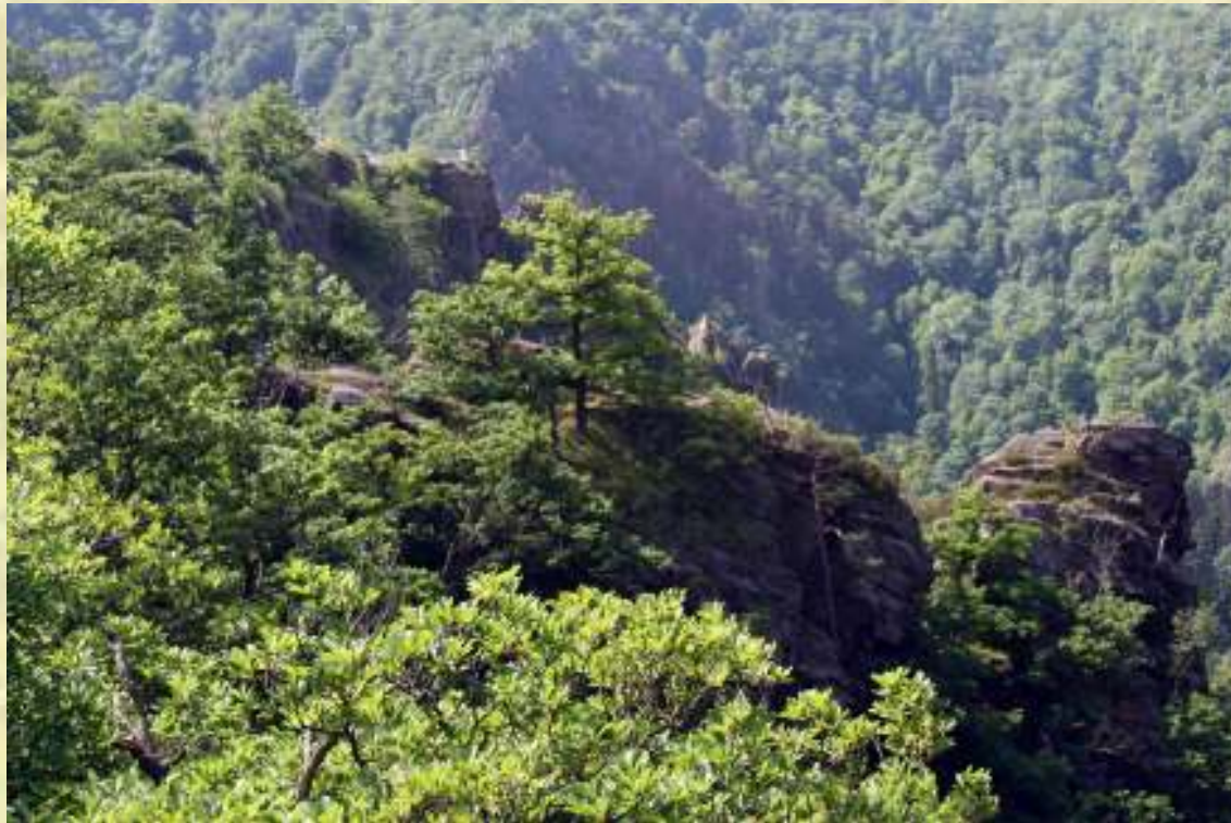
Nr. 71: Roßtrappe