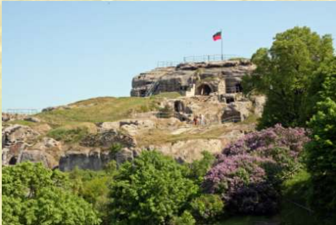
Nr. 80: Burgruine Regenstein