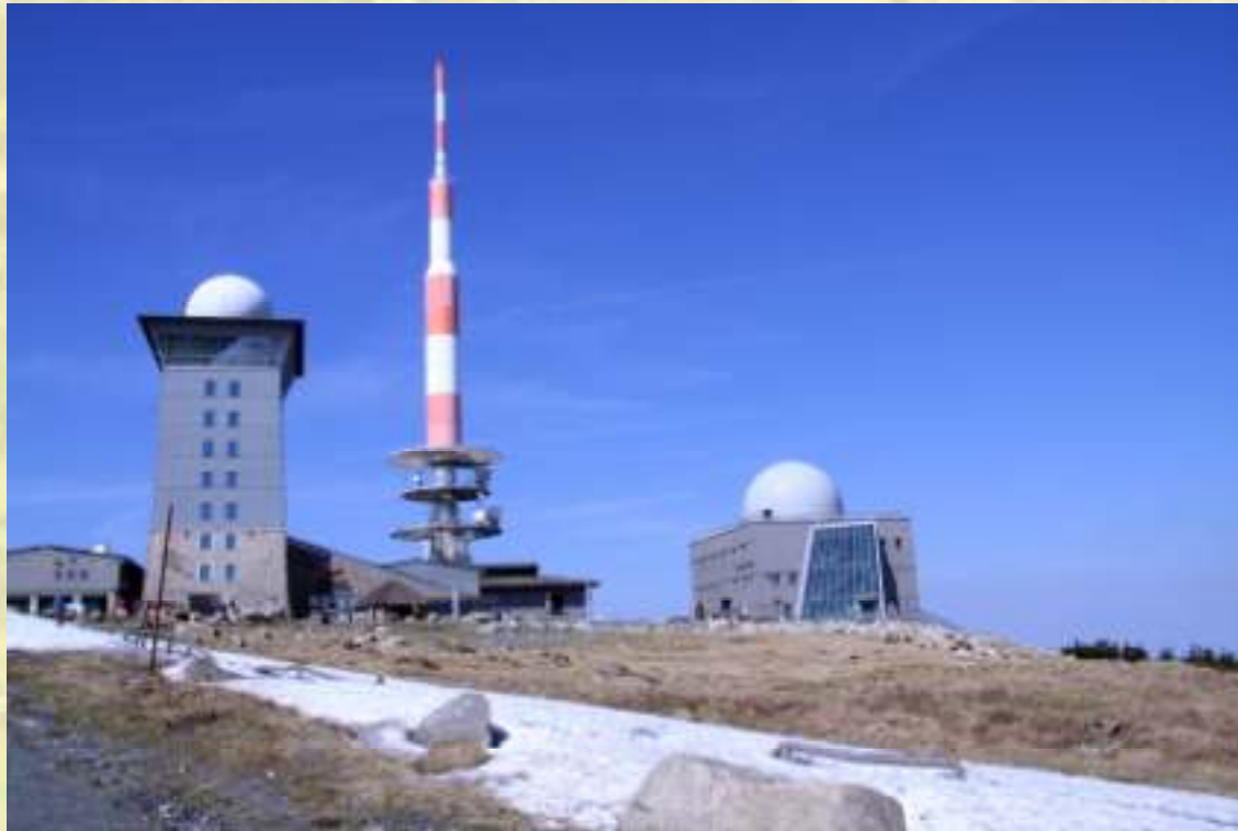
Nr. 9: Brockenhaus