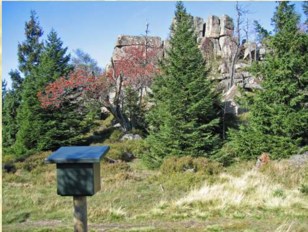
Nr. 10: Große Zeterklippe