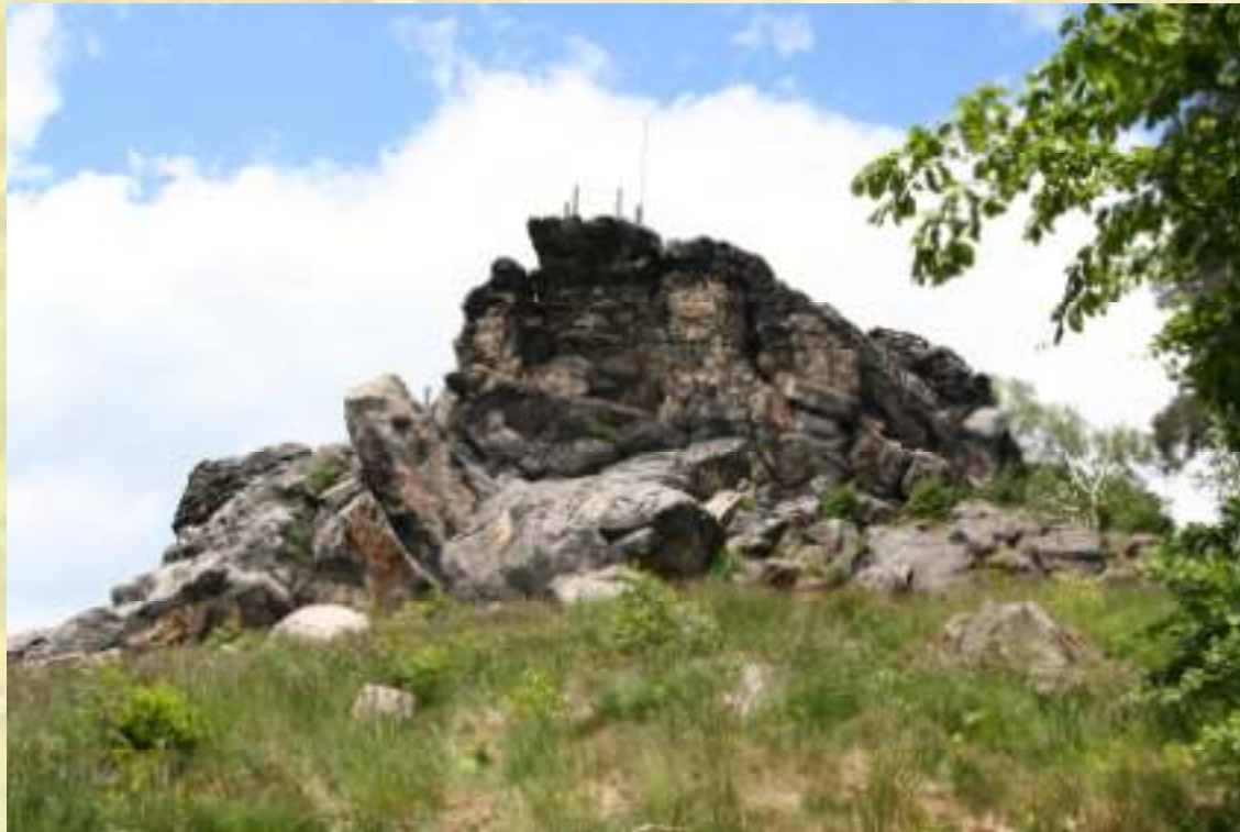
Nr. 76: Großvater Felsen