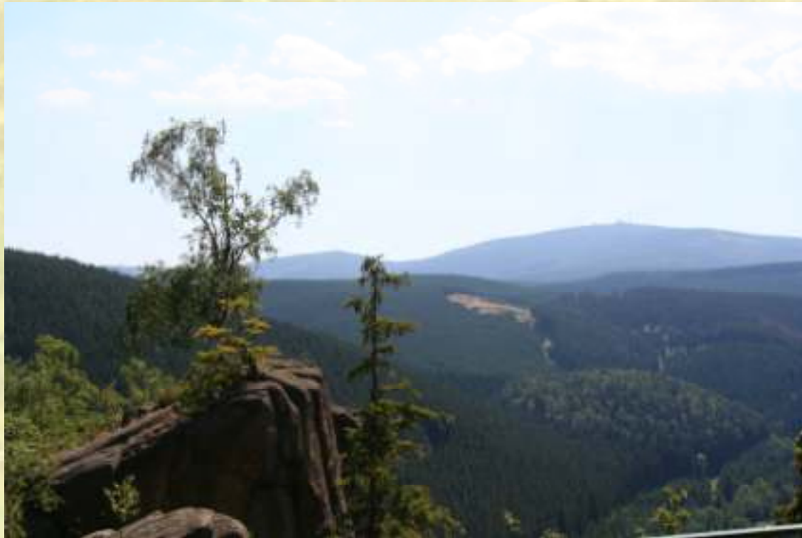
Nr. 170: Rabenklippe