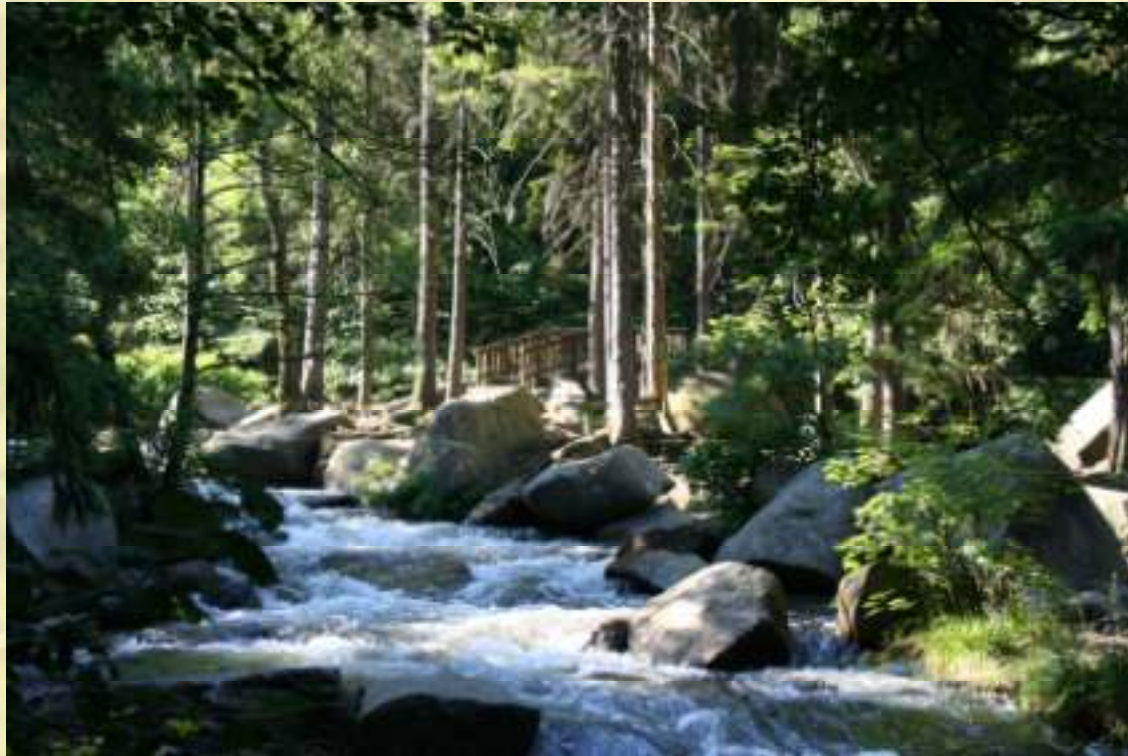
Nr. 116: Verlobungsinsel in der Oker